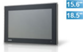
FPM-7151W / 7181W